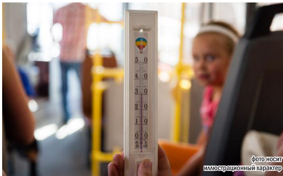
фото носит иллюстрационный характер

От директора АП-1 Алешко В.Г. получен ответ на два коллективных заявления работников ОАО «Беларуськалий» с претензиями к техническому состоянию автобусов.