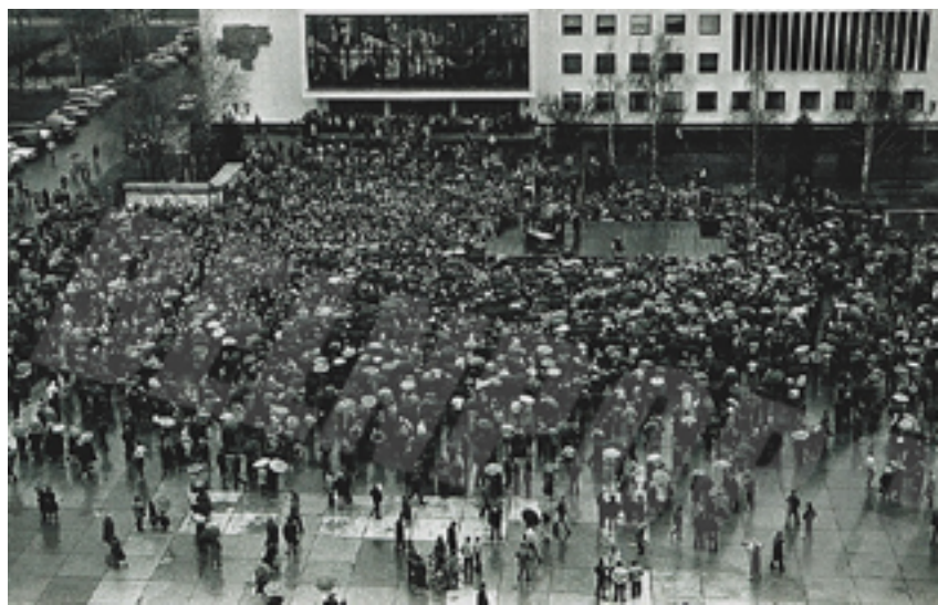
• Забастовка в Солигорске, 5 апреля 1991 года

В апреле 1991-го кроме Минска и Солигорска, забастовку объявили железнодорожники Орши, перекрывшие пути сообщения.